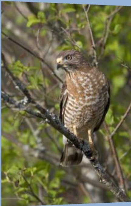
Águila cuaresmerá ( Buteo platycterus )