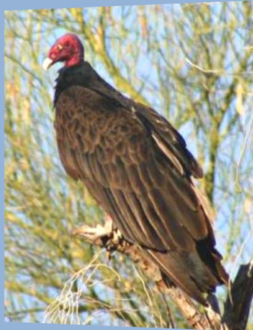
Guala o Chulo cabeza roja ( Cathartes aura )

Como todos los años para el mes de Septiembre, Octubre, Noviembre se comienza a registrar la llegada de grandes poblaciones de aves migratoria provenientes de Norte y Centro América. En Colombia en el 2010 a través de la Red Nacional de Observadores de Aves (RNOA) ya se han comenzado a registrar bandadas de Águilas Cuaresmeras atravesando las zonas montañosas del País.