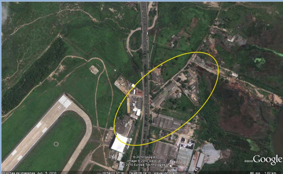
Cabecera 23. Sector donde es posible observar concertaciones de aves Carroñeras y Migratorias en horas de la mañana

probabilidades de impactos se incrementa. Por antecedentes se han registrado algunos eventos sin ninguna consecuencia.